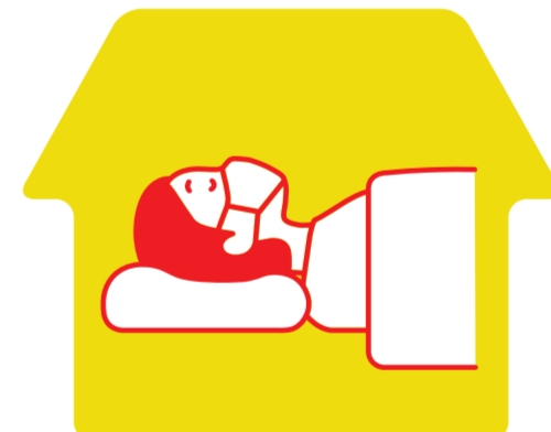
体調不良の場合は自宅で安静に