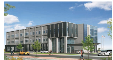
新弘前地域研究所完成予想図

○申込方法 参加申込書に必要事項をご記入の上 FAX または E-mail にてお申込みください。