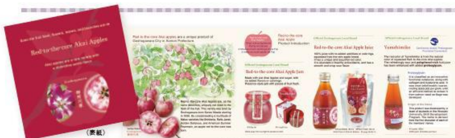
成果物: 英語版パンフレット