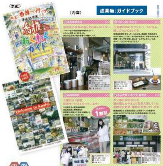
成果物:ガイドブック