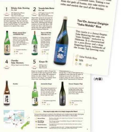
成果物: パンフレット