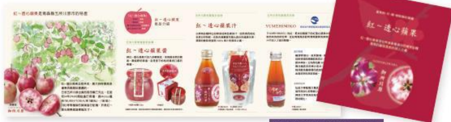
成果物: 中国語版パンフレット