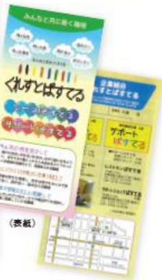
成果物: パンフレット